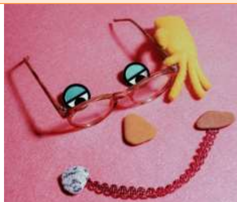
© Girl with red hat sur Unsplash